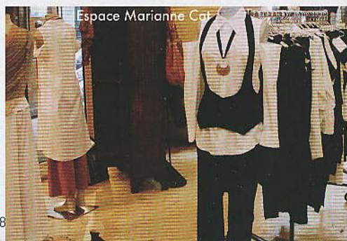
Espace Marianne Cat

Espace Marianne Cat. « Pour son atmosphère new-yorkaise et la façon dont les marques cohabitent. » 53, rue Grignan, Marseille 6°. Tél.: 04 91 55 05 25.