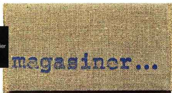
Les Petites Emplettes Porte-chéquier en lin brut, 20 €.