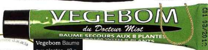
Vegebom Baume aux plantes, 40 g, 5,90 €, et pastilles gomme d'acacia, 50 g, 3,97 €.