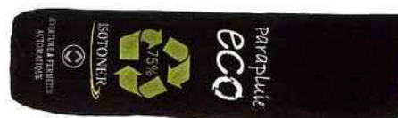
Isotoner Parapluie de sac, poignée en bambou, tissu et structure métallique en matériaux recyclés, 17 €.