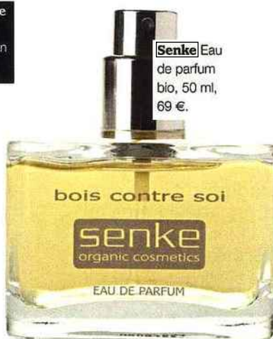
Senke Eau de parfum bio, 50 ml, 69 €.