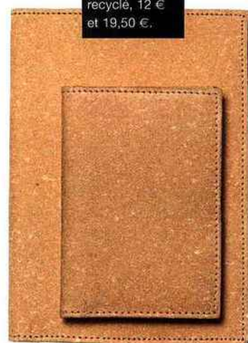
Muji Porte-cartes et porte-feuille en cuir recyclé, 12 € et 19,50 €.