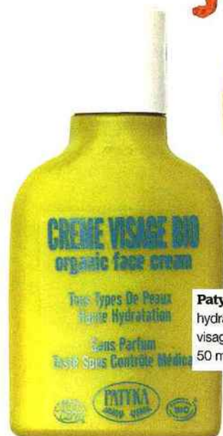
Patyka Crème hydratante visage bio, 50 ml, 8,95 €.