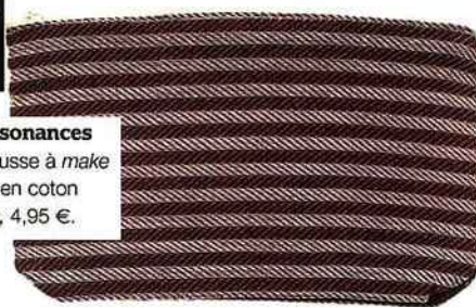
Résonances Trousse à make up en coton bio, 4,95 €.