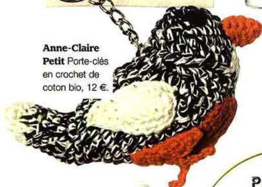
Anne-Claire Petit Porte-clés en crochet de coton bio, 12 €.