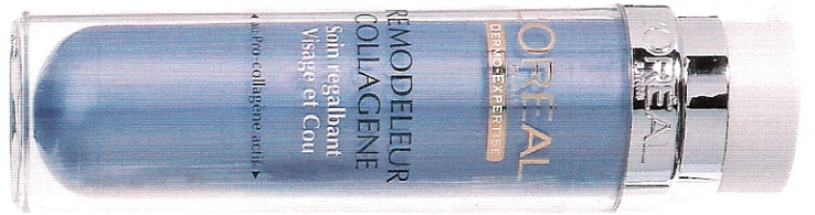
Remodeleur Collagène, 50 ml, 18,29 €, L'Oréal Paris.