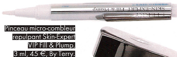
Pinceau micro-combleur repulpant Skin-Expert VIP Fill & Plump, 3 ml, 45 €, By Terry.