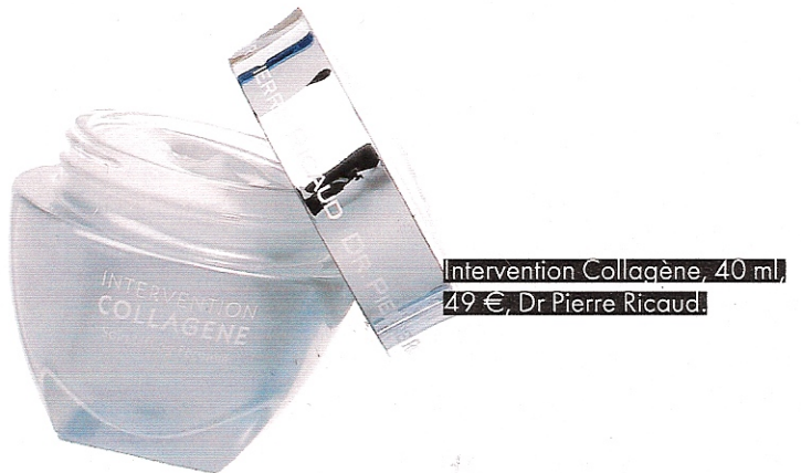
Intervention Collagène, 40 ml, 49 €, Dr Pierre Ricaud.