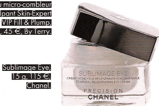
Sublimage Eye, 15 g, 115 €, Chanel.