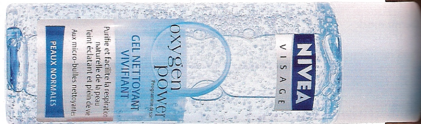
Gel Nettoyant Vivifiant Oxygen Power, 200 ml, 5,70 €, Nivea Visage.