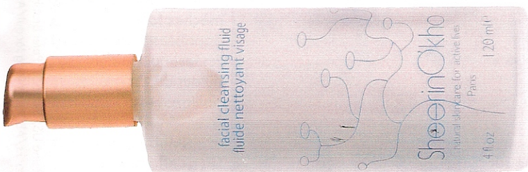
Fluide Nettoyant Visage, 125 ml, 26 €, SheerinO'kho.