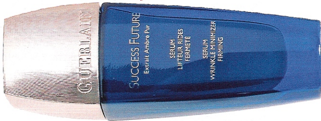
Sérum Liftéur Success Future, 30 ml, 108 €, Guerlain.