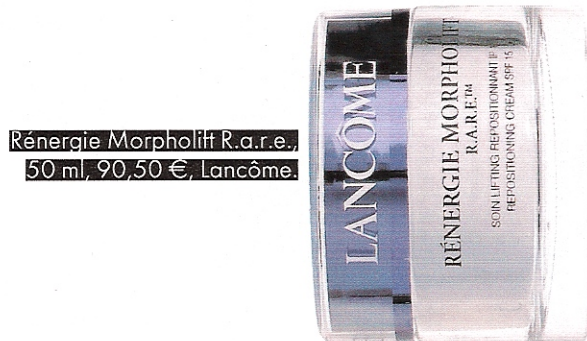
Rénergie Morpholift R.a.r.e., 50 ml, 90,50 €, Lancôme.