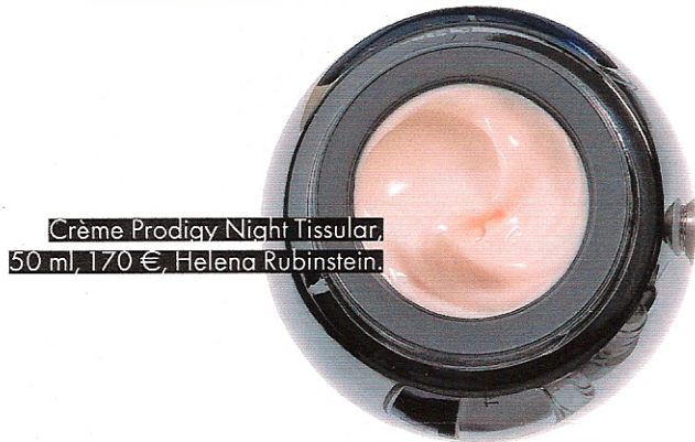
Crème Prodigy Night Tissular, 50 ml, 170 €, Helena Rubinstein.