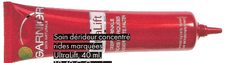
Soins dérideur concentrés rides marquées UltraLift, 40 ml, 12,49 €, Garnier.