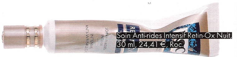
Soin Anti-rides Intensif Retin-Ox Nuit, 30 ml, 24,41 €, Roc.